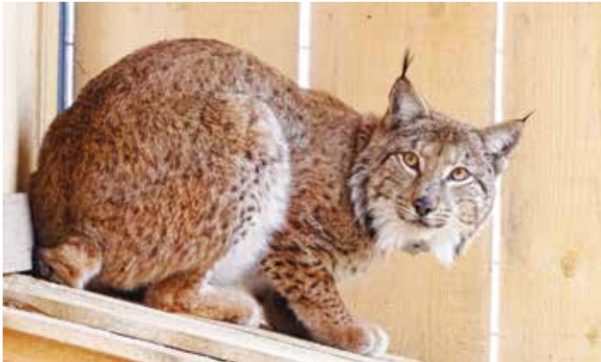
Tris v prilagoditveni obori.

V začetku marca so v prilagoditveno oboro na Pokljuki pripeljali prvega risa, ki bo izpuščen na Gorenjskem. Ime za risa, ki so ga pripeljali iz Romunije, so izbirali učenci Skupnosti šol Biosfernega območja Julijske Alpe in so ga poimenovali Tris (triglavski ris).