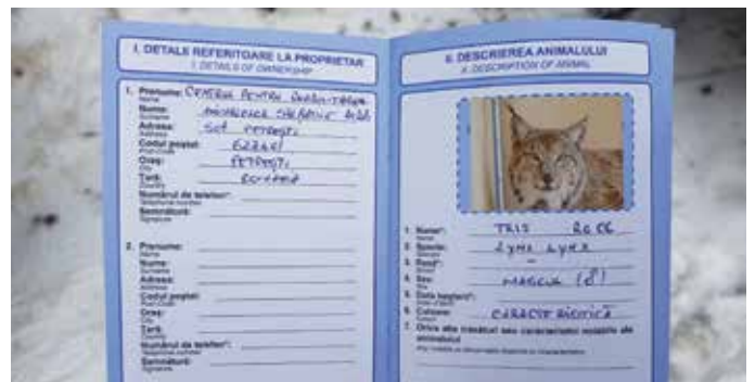
Trisov potni list.